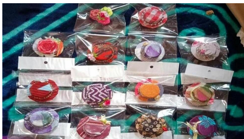
Gambar 5: pendampingan daur ulang sampah menjadi kerajinan tangan

Pendampingan daur ulang sampah selain turut serta dalam menjaga ekosistem dan kebersihan lingkungan juga sebagai pengembangan ekonomi kreatif berbasis rumah tangga yang bisa memberikan tambahan penghasilan kepada para perempuan. Selain itu