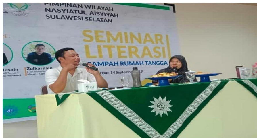
Gambar 3. Pemateri kedua memberika arahan terkait bahaya sampah plastik

menjadi negara terdepan di sektor maritim. Tulisan ini menganalisis upaya Pemerintah Indonesia dalam mengatasi sampah plastik di laut. Di beberapa konvensi internasional, Indonesia telah menyampaikan komitmennya untuk menurunkan 70% sampah plastik di laut pada tahun 2025. Komitmen tersebut tertuang dalam Rencana Aksi Nasional Pengelolaan Sampah Plastik di Laut (2017-2025). Mengatasi sampah di laut berarti mengelola sampah di darat dengan baik karena 80% sampah laut berasal dari darat. Pendekatan yang digunakan pula tidak hanya yang bersifat instan dan berorientasi jangka pendek, tetapi juga bersifat holistik dan berorientasi jangka panjang. Indonesia memang telah menaruh perhatian khusus terhadap masalah ini. Namun, hal yang terpenting adalah bagaimana program pengurangan sampah plastik di laut ini benar-benar terlaksana dalam rangka mengubah citra buruk Indonesia di mata dunia. Meskipun tidak bisa mengurangi sampah secara langsung, setidaknya para perempuan rumah tangga bisa mengantisipasi untuk mengurangi penggunaan sampah plastik dengan bijak. Para peserta juga diberikan pemahaman mengenai alternatif yang dapat dilakukan untuk mengurangi sampah plastik dan turut serta mengkampanyekan hal tersebut pada masyarakat luas dengan berbagai cara, baik melalui social media maupun melalui perkumpulan seperti arisan dan majelis taklim atau melalui kegiatan dakwah yang dilakukan oleh Nasyiah.