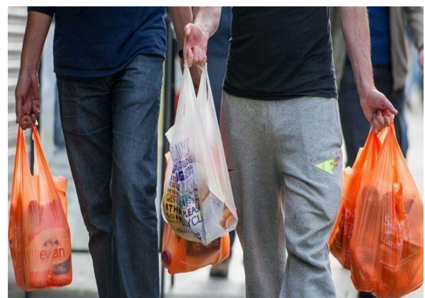
Gambar 4: Slide Materi bahaya sampah plastik